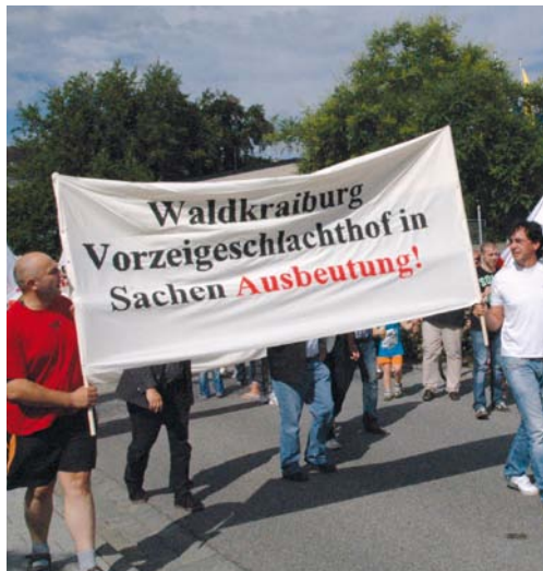
Protest gegen Dumpinglöhne: Betroffene, Gewerkschaftsmitglieder und solidarische Bürger demonstrieren im Juli 2012 in Waldkraiburg.

Der Anwalt schüttelt den Kopf. Das, was da in Kopie vor ihm liegt, hat mit gängigen Vorstellungen von einem Arbeitsvertrag wenig zu tun – und würde vor einem deutschen Gericht vermutlich kaum Bestand haben. Die Gewerkschaft NGG hat das Dokument übersetzen lassen, das eine Frau unterschreiben sollte, um ihren Job im Schlachthof Waldkraiburg zu behalten. Die Bedingungen, die die rumänische Werkvertragsfirma Salamandra Plus in dem Papier festschreibt, haben es in sich: 800 rumänische Lei (rund 178 Euro) monatlich soll sie als „Grundgehalt“ bei einer 40-Stunden-Woche verdienen. Zwar ist in dem Vertrag von „weiteren Vergütungen“ die Rede – wie hoch die ausfallen, wird jedoch nicht bestimmt. Dafür werden mögliche Geldstrafen in einer Anlage genau aufgelistet: Wer den Job aufgibt, ohne die vorgesehene Kündigungsfrist von 20 Werktagen einzuhalten, muss 2000 Euro zahlen. Kommt es während der Arbeit zu einem Diebstahl und ist der Täter nicht auffindig zu machen, „wird die Geldstrafe gemeinschaftlich bezahlt“: 5000 Euro sollen die Wanderarbeiterinnen und Wanderarbeiter dann zusammenlegen. Wer „aus Unachtsamkeit“ einen Arbeitsunfall hat, muss Arzt- und Krankenhauskosten selbst tragen. Und sollte der Schlachthofbetreiber „wegen schlechter Qualität des Fleisches“ eine Vertragsstrafe gegen die Werkvertragsfirma verhängen, „überträgt der Arbeitgeber die Geldstrafe auf den Arbeitnehmer“ (siehe Seite 48). Tiefstes Mittelalter also – mitten in Deutschland. Und das anscheinend völlig legal.